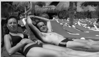
I "fusi"... orari del Messico