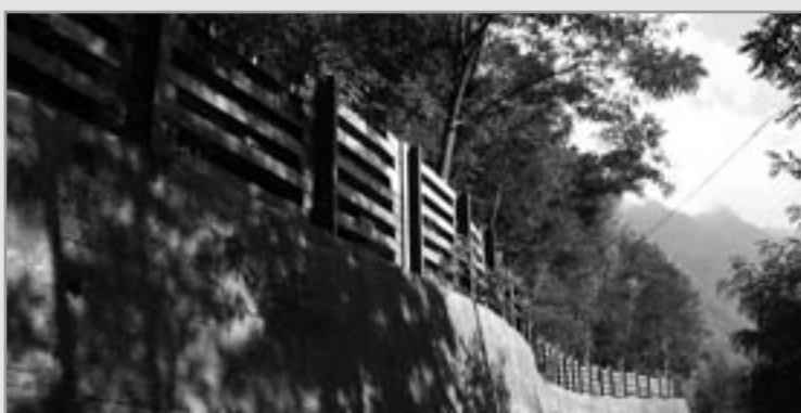
Realizzazione della palizzata paramassi lungo la strada comunale di Migondo