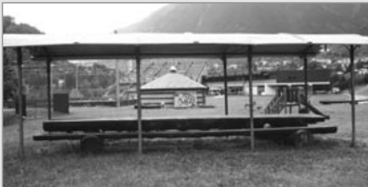
Realizzazione della copertura con assito di larice del gazebo nell'area verde del centro polifunzionale